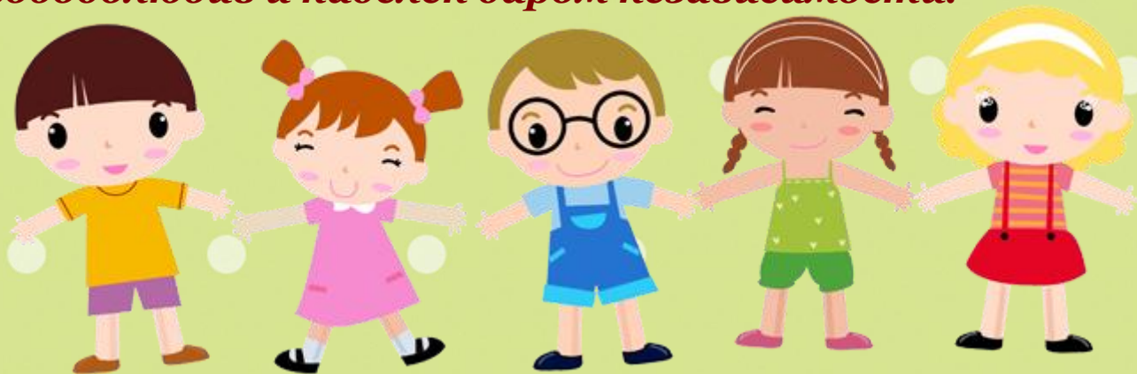
Рисунок – это проекция чувств и переживаний ребенка. Будучи напрямую связанным с важнейшими психическими функциями – зрением, двигательной координацией, речью, мышлением, рисование не просто способствует развитию каждой из этих функций, но и связывает их между собой.

Самое любимое и близкое ему существо малыш постарается раскрасить тем же цветом, что и себя. Напористые и непосредственные выбирают обычно теплые и горячие цвета – малиновый, оранжевый. Холодные тона предпочитают тихие, мечтательные, серьёзные малыши. Их привлекают синий, голубой, бледно-желтый. Контраст чёрного и белого – отражение внутреннего конфликта, с которым ребёнок не может справиться. Обращайте внимание, как ваше дитя раскрашивает изображение. Если карандаш то и дело выскакивает за пределы контура, значит, малыш свободолобив и наделён даром независимости.