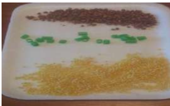
Пшено, греча, трубочки от коктейля (части)

3. Приготовим крупу (зелёное – нарезанные трубочки от коктейля)