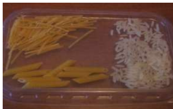
лапша, макароны, рис.