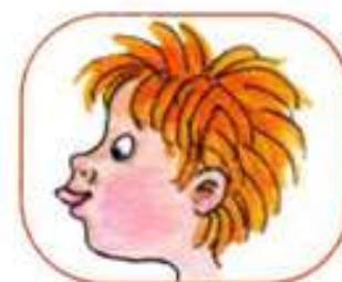
Загнать мяч в ворота

Шарик надулся - надуть щеки Шарик лопнул - сдуть щеки