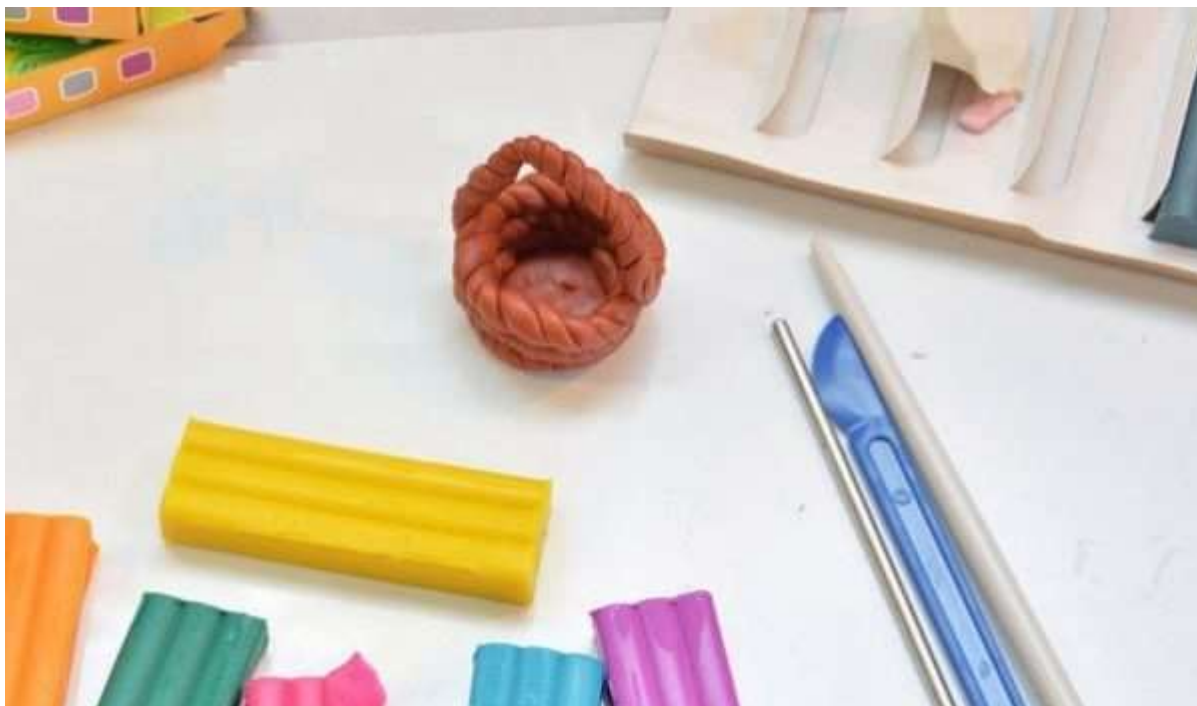
Четвёртый жгутик станет ручкой корзинки