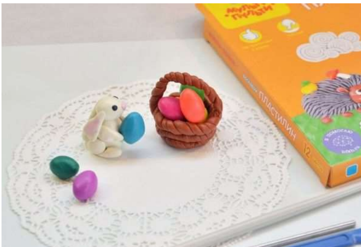
Ячки нужно делать из кусочков пластилина ярких цветов, чтобы они оттеняли корзинку