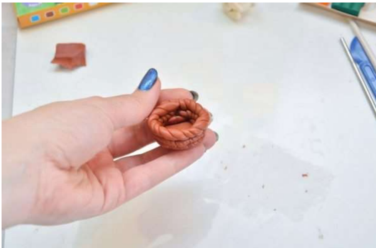
Круги из жгутиков образуют бока корзинки